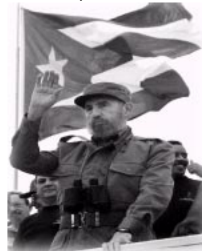
Der Genosse Präsident Dr. Fidel Castro Ruz