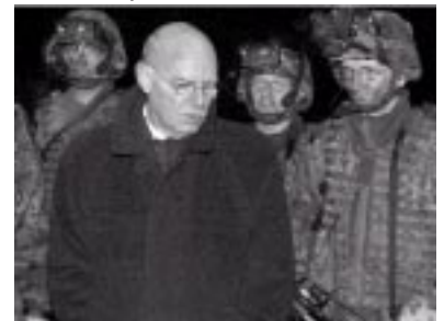
Kriegsminister Struck (SPD) mit seinen „Ausbildern“

Die Ausbildung der irakischen Einheiten, soll in etwa einem Monat abgeschlossen sein. Auf diesem Weg, werden die deutschen Interessen im Irak auf dem Schleichweg gesichert. Und jetzt soll noch einer etwas über die „Friedenspolitik“ der Bundesregierung während des Irakkrieges faseln. Es gab keine Friedenspolitik; und es gibt keine Friedenspolitik.