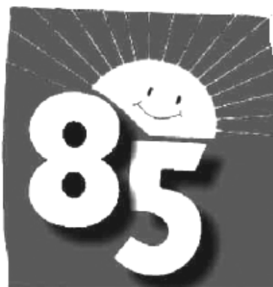
Das könnte uns also blühen.

Regierungsfraktionen in den Landtagen, die hinzugewonnenen Kompetenzen auch zu nutzen und „nicht einfach nur alles abzunicken, was von der Regierung kommt“. Das unter diesen Umständen auch Missbrauch betrieben werden kann sollte uns allen klar sein. So soll laut Koch Hessen im Strafvollzug zu einem „Vorreiter für einen modernen Strafvollzug in Deutschland werden“. Bei einem Mann wie Koch kann das schlimme Folgen haben. Koch kündigte zudem abweichende Landesregelungen zum Umweltrecht des Bundes an und bekräftigte seine Absicht, die Ladenöffnungszeiten an Werktagen völlig freizugeben.