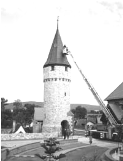
Der im Text angesprochene Turm ist nicht der hier abgebildete „Hexenturm“ sondern der Turm rechts neben der Drehleiter. Aus redaktionellen Gründen haben wir uns für dieses Foto entschieden

Nach über einem halben Jahr wurde der Turm an der „Ritter von“ Marx Brücke nun endlich fertiggestellt.